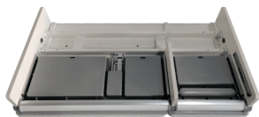
Рама стола со столешницей